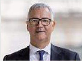
Presidente Stefano Cuzzilla

U na petizione per difendere il ceto medio da eventuali nuovi interventi, in particolare sulla indicizzazione al costo della vita. A lanciare l'iniziativa è la Cida , confederazione dei dirigenti, perché, spiega il presidente Stefano Cuzzilla , «il sistema previdenziale italiano non può attingere soltanto alle tasche del ceto medio». Già con la manovra dello