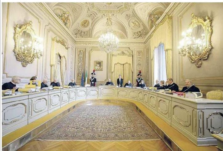
Nel 2015 la Consulta aveva ritenuto illegittimo la misura del governo Monti che azzerava la rivalutazione per i trattamenti superiori a tre volte il minimo Inps. Nella foto l'aula della Corte costituzionale, a Roma